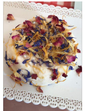
Le petit dernier le Tilly fleury