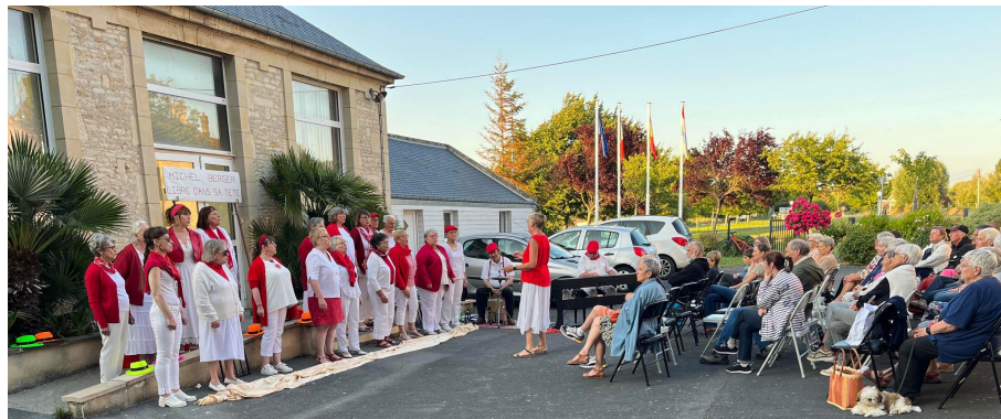
La chorale Arpador chante Michel Berger.