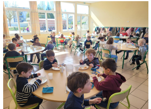
Cantine de Merville-Franceville