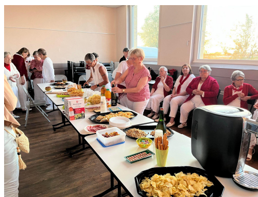
Après l'effort.....le réconfort.