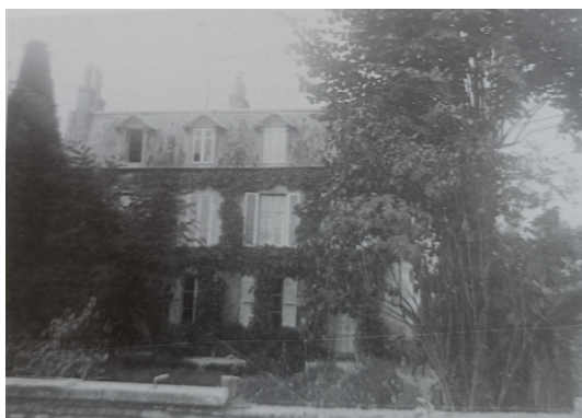
Sa propriété au 13 de la rue André Pierre-Marie