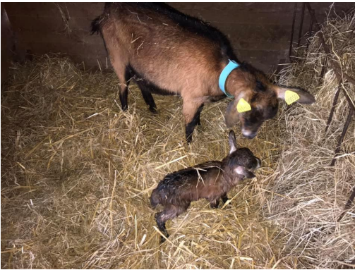
La petite dernière de 2023 : Georgette