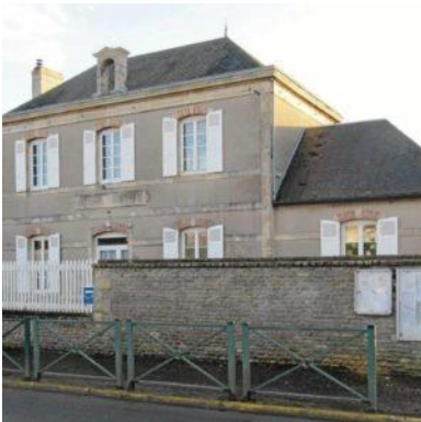
Ecole de Bréville les monts