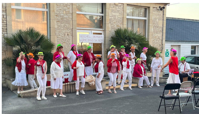
La chorale Arpador chante Stromae : « Alors on danse »